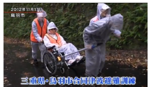
三重県・鳥羽市合同津波避難訓練

2013/3/27 テレビ東京ワールドビジネスサテライト トレンドたま このコーナーで取り上げられました。他、多数OA有