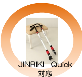
JINRIKI Quick 対応