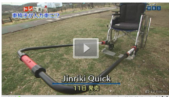
Jinriki Quick 11日発売